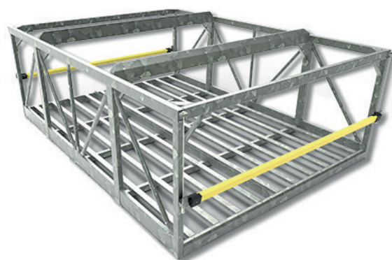
Casier 35 bouteilles avec barres composites de fermeture